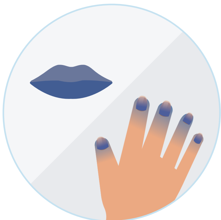
Sianosis (Bibir atau Kuku Berwarna Biru-ungu)