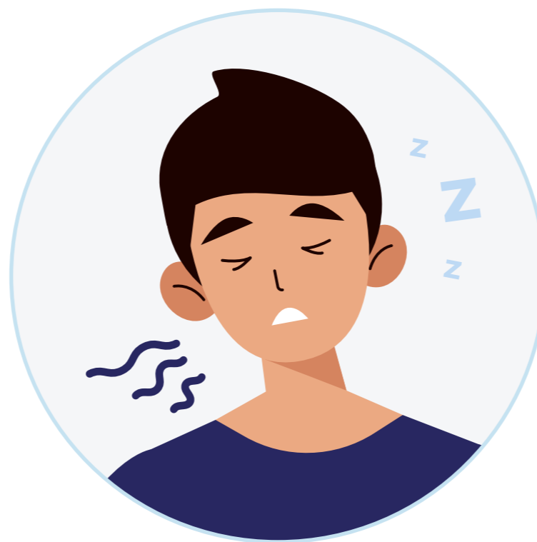
Kelesuan yang Bertambah Teruk