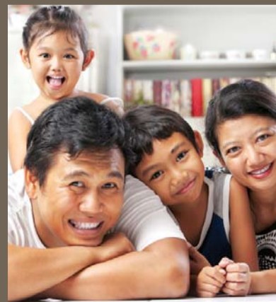
建立积极的生活态度