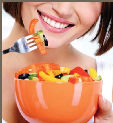
养成健康的饮食习惯