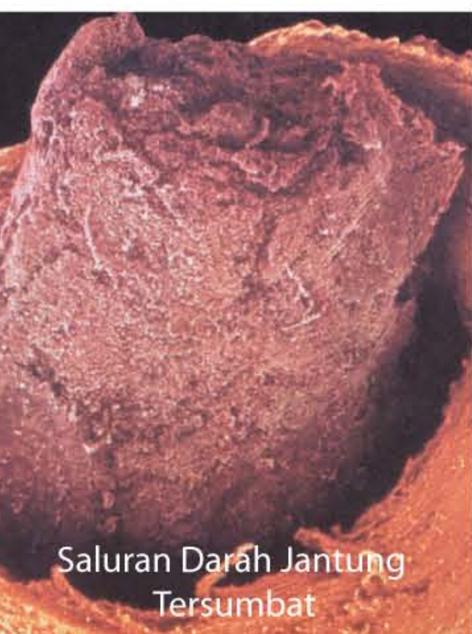
Saluran Darah Jantung Tersumbat

Penyakit Saluran Pernafasan Obstruktif Kronik