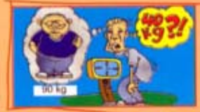
உடல் எடை குறைதல்