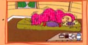
நீண்ட நாட்களுக்குக் காய்ச்சல்