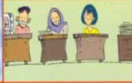
ஒன்றாக வேலை செய்வதால்