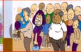
மக்கள் நிறைந்த பகுதிகளில்