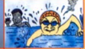
நீச்சல் குளத்தில் நீந்துவதால்