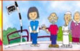
பொது கிடங்களைப் பயன்படுத்துவதால்