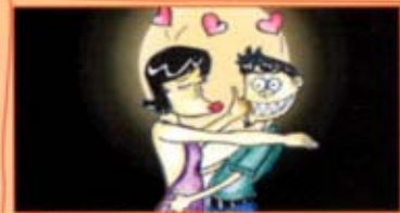
和异性或同性发生性关系