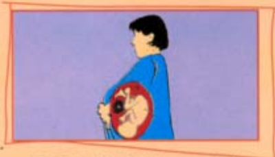
从母亲传染给怀孕胎儿